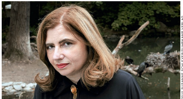
Sibylle Lewitscharoff: Die Autorin entpuppt sich als Katzenkennerin