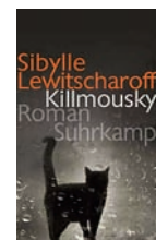
Sibylle Lewitscharoff Killmousky 223 Seiten (Suhrkamp 2014).